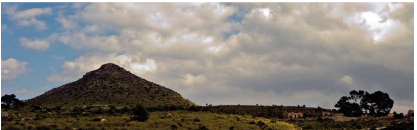
Puig des Porrassar