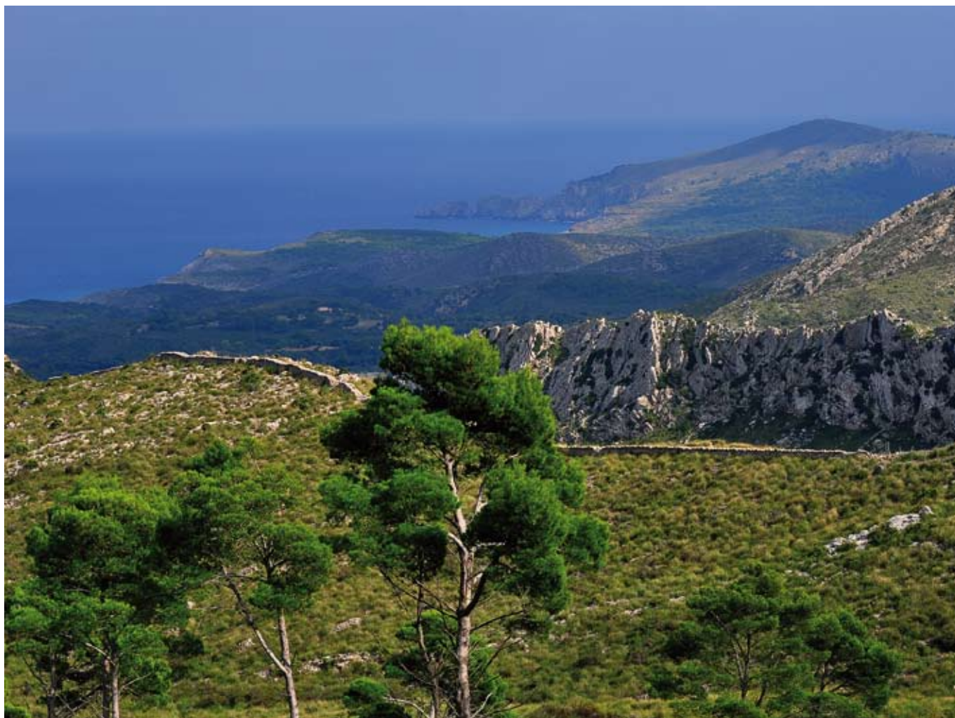
Panoràmica des del camí

Per tal d'afavorir la recuperació de la vegetació, la gestió del Parc ha fet i continua fent repoblacions forestals mixtes, amb pins, ullastres, alzines i diverses espècies de sotabosc. D'altra banda, i per reduir el risc d'incendi, es desenvolupen diferents accions de prevenció, com l'obertura de franges de baixa