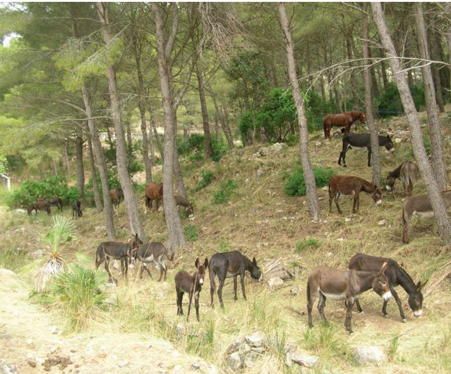
Pastura controlada en una faixa o tallafoc

densitat de vegetació als costats dels camins mitjançant el pasturatge d'ases, someres i vaques.