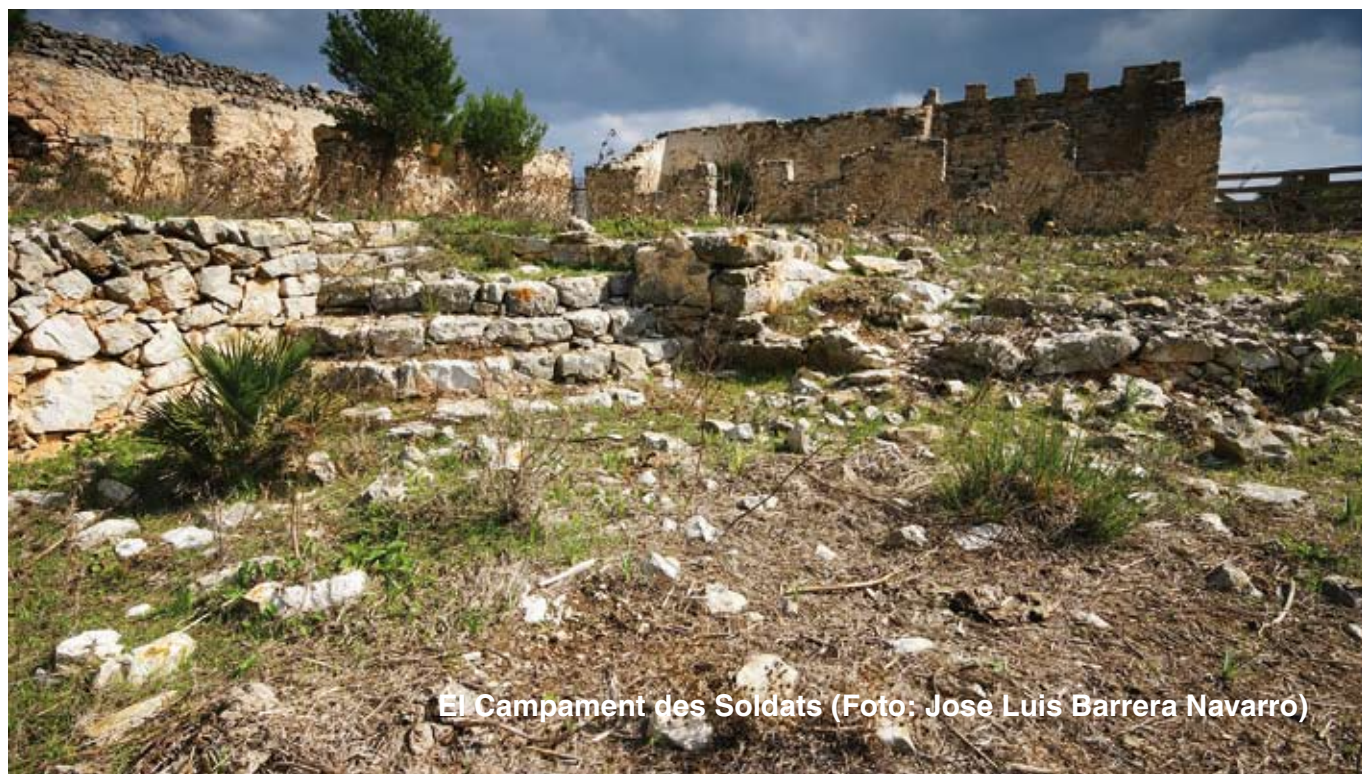
El Campament des Soldats

Aquest element és únic a Mallorca i molt poc comú a tot l'Estat, ja que els camps de reclusió normalment eren construccions desmuntables i no de pedra, com les que aquí podem observar. Entre les restes del Campament s'hi intueixen les distintes dependències que feren la funció d'estança dels comandaments, de cuina, de magatzem i d'infermeria, a més dels barracons dels presos, que es mantenen en un estat de conservació molt deficient, i amb prou feines podem imaginar les condicions en què hi visqueren.