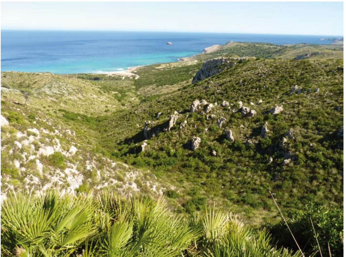
El torrent des Porrassar

Els diferents trams dels torrents adopten noms distints segons els indrets pels quals transcorren. Aquí veim ramificacions del torrent des Porrassar, que, quan s'ajunta més avall amb el de s'Arboçaret, formen el torrent des Castellot, que desemboca a la cala de la Font Celada.