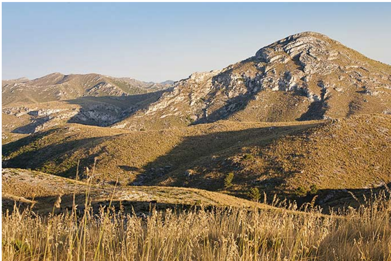
Puig des Porrassar

però a més distància, són les penyes de na Pastora (350 m), just abans de la vall des Verger; la talaia de Son Jaumell (273 m), amb una torre per vigilar la costa gabellina, i el puig de sa Vinyassa (361 m).