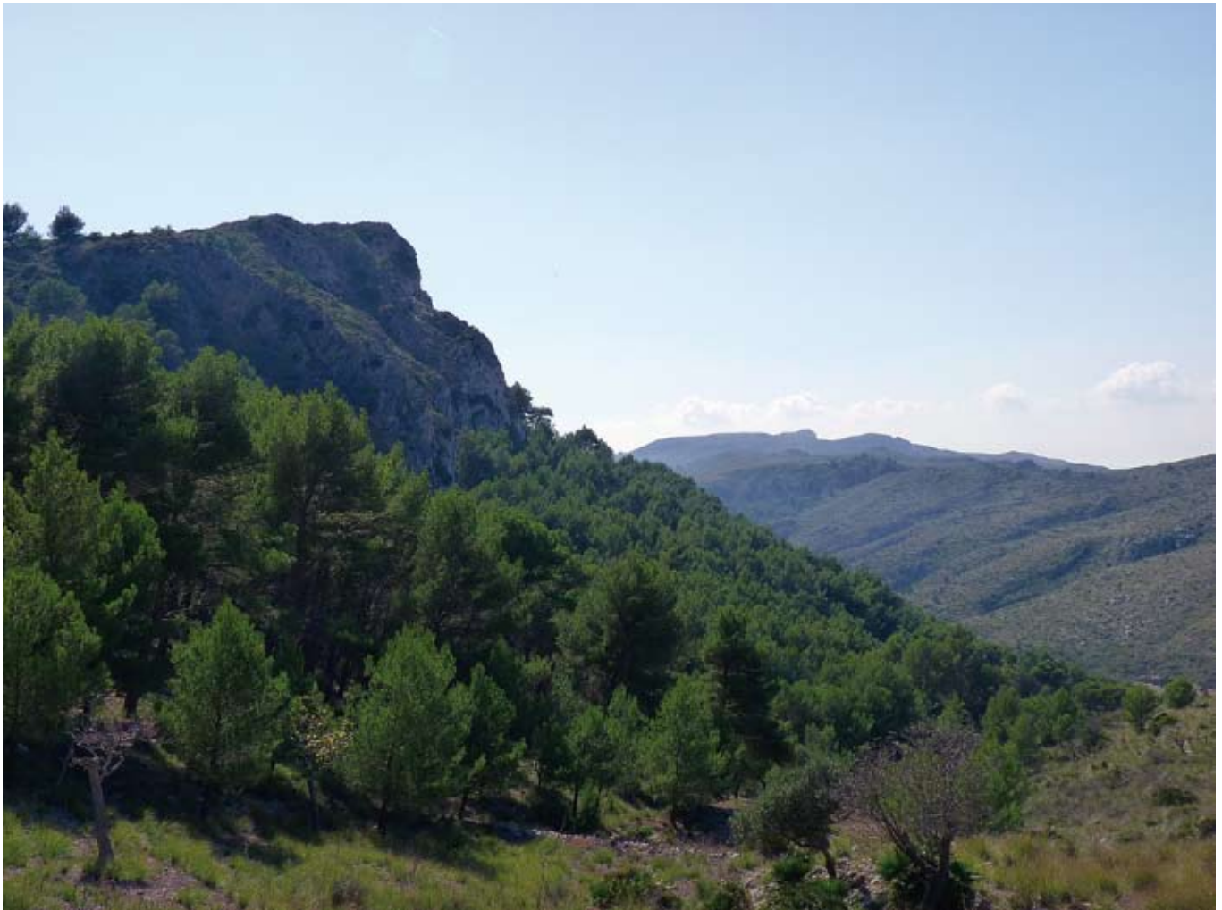
Puig des Corb

Travessam el Campament i iniciam la caminada pel tirany que s'allunya d'aquí en direcció sud-est. Passat el tancat que envolta el conjunt de runes, hi trobam un aljub i unes piques, que també emprava la colònia penitenciària. Poc després veim una darrera caseta i el traçat senyalitzat ens condueix a l'esquerra, deixant a la nostra esquena el puig des Corb.