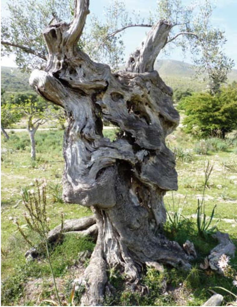
Olivera centenària

Seguint la nostra ruta travessam l'olivar de ses Monjoies i una zona d'alzinar fins arribar a l'encreuament amb el camí procedent de Son Puça. Penjades de les oliveres hi ha trampes de fosfat per a prevenir la plaga de la mosca de l'olivera.