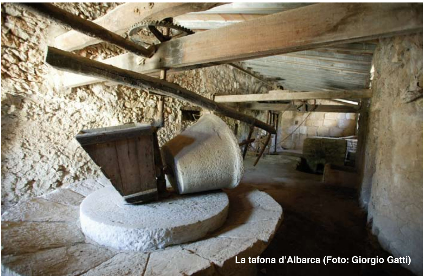
La tafona d'Albarca

A partir de les olives que es cullen a Albarca s'elabora oli d'oliva de producció ecològica, molt apreciat. Les olives es premsen fora de les finques, si bé resta encara en bon estat de conservació la tafona d'Albarca adossada a la part posterior de la casa dels amos.